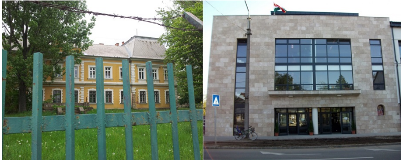
A képen a görögkatolikusok nyíregyházi iskolái – a belvárosi elit- és a telepi iskola látható.

A köznevelési törvény tavalyi módosításakor felhatalmazást kapott a kormány, hogy a vallási, világnézeti tekintetben elkötelezett gyerekek oktatásának feltételeit rendeletben állapítsa meg – már akkor elég egyértelmű volt, hogy mindez az elkülönítést fogja szolgálni. A jogvédők tiltakozását akkor a kormány „rosszindulatú és alaptalan híresztelésnek” minősítette . Pedig a mostani rendelet-tervezet egyértelműen bizonyítja, hogy egy – az elkülönítés erőteljes kiterjesztését célzó – átgondolt stratégia első lépését valósították meg.